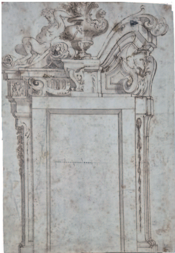
Fig. 1. Disegno di portale in duplice versione, inizi XVIII secolo? (Palermo, collezione privata).