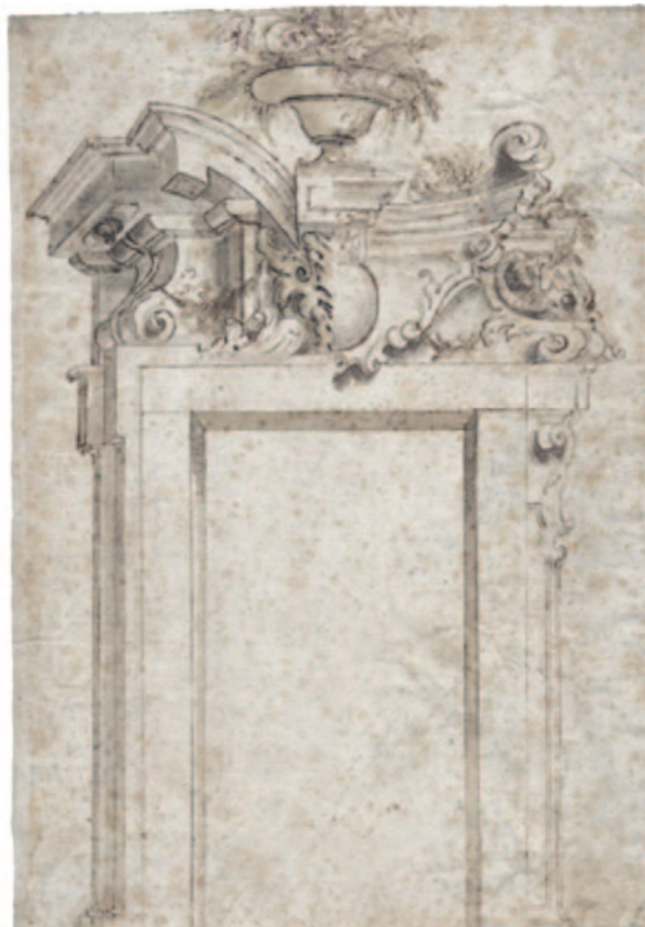
Fig. 2. Disegno di portale in duplice versione della stessa serie del precedente, attuale ubicazione sconosciuta ( https://bassenge.com/lots/104/62410 ).