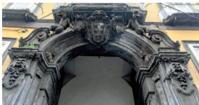
Fig. 3. Napoli, particolare del portale Carafa della Spina.