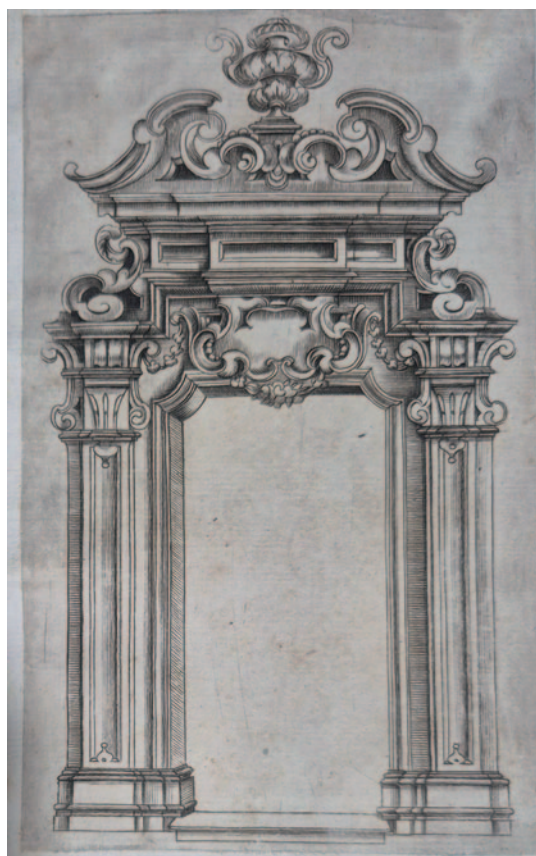
Fig. 4. Bonaventura Presti, incisione di modello per portale 1660 ca. (Palermo, collezione privata).