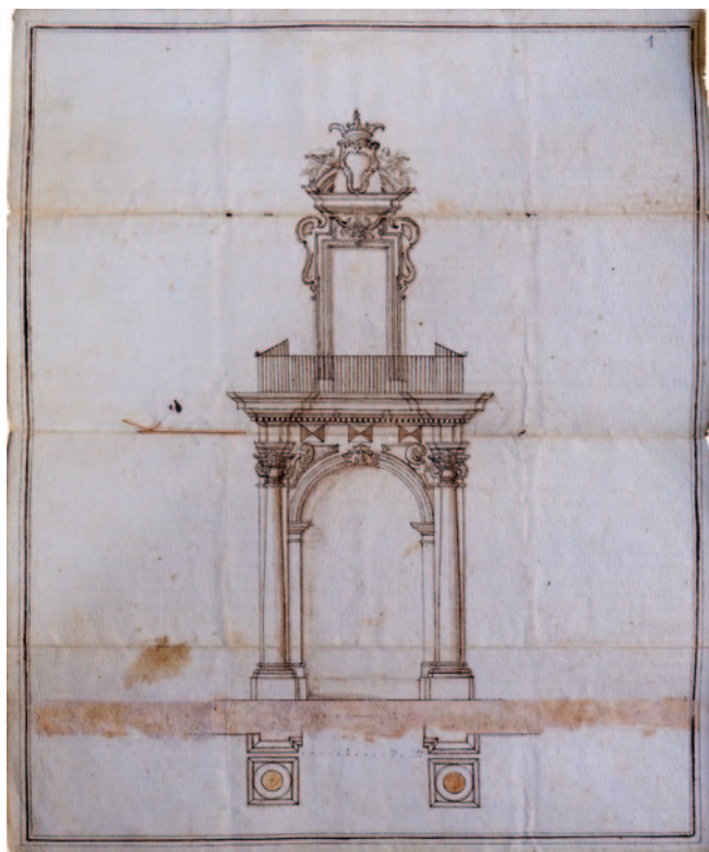
Fig. 6. Progetto per il portale di palazzo Marinis di Sangro.

Anche dubitando, per più ragioni, di una diretta partecipazione al disegno in questione, Giovan Battista Manni resta il principale indiziato del progetto complessivo del palazzo. L'architetto appare oggi un tecnico prolifico, apprezzabile anche come disegnatore, tuttavia sostanzialmente in ombra rispetto ad alcuni colleghi contemporanei. Il disegno aiuta a individuare in questo caso alcune fonti formali del progetto che potrebbero persino contribuire a svelare una componente formativa. Le sagome delle finestre e del portale rimandano chiaramente a una delle tavole del libretto