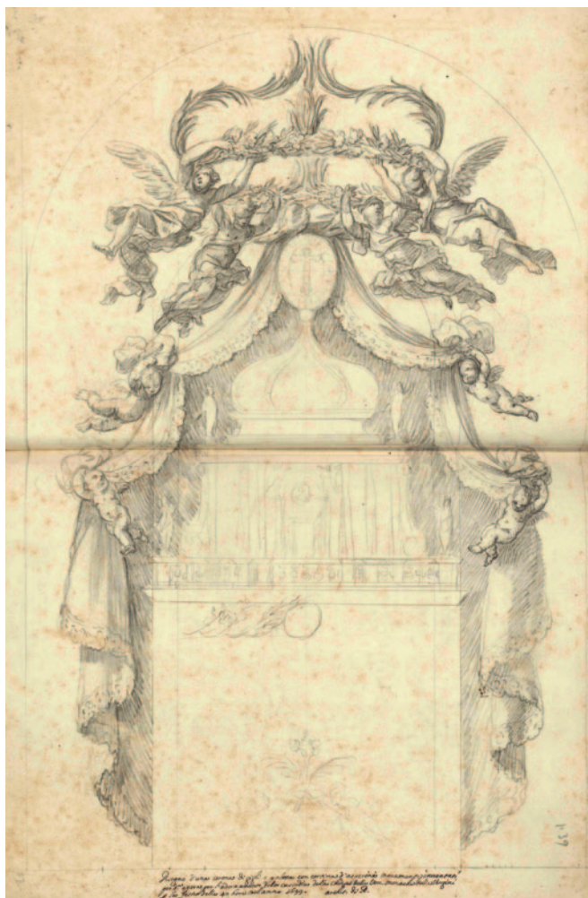
Fig. 3. Giacomo Amato e Antonio Grano, decorazione del tabernacolo della chiesa delle Vergini per la festa delle Quarantore, 1699, matita nera e acquerello in toni di grigio, 635 x 415 mm (Palermo, Galleria Regionale della Sicilia di Palazzo Abatellis, Gabinetto Disegni e Stampe, inv. 15757/dis.32).

Arti Grafiche del Louvre [fig. 6] 23 , che offre l'opportunità di avviare una riflessione sul tema della produzione autografa del pittore destinata alla chiesa delle Vergini. L'opera, esposta in occasione della mostra Splendeurs baroques de Naples (Poitiers 2006-2007), con attribuzione al cosiddetto Pseudo Nicola Maria Rossi 24 , è stata in seguito convincentemente ricondotta da Catherine Monbeig Goguel alla produzione grafica di Grano 25 . La studiosa, difatti, a partire dal 2010 ha delineato un consistente gruppo di opere grafiche riconducibili al pittore siciliano, prendendo le mosse dalla revisione di una serie di disegni del museo parigino, già raggruppati da Walter Vitzhum sotto il nome del napoletano Nicola Maria Rossi (1690-1758), allievo del Solimena. Attraverso un loro attento riesame, Monbeig Goguel non soltanto ha esteso tale attribuzione a ulteriori fogli presenti nello stesso museo e in altre collezioni interna-