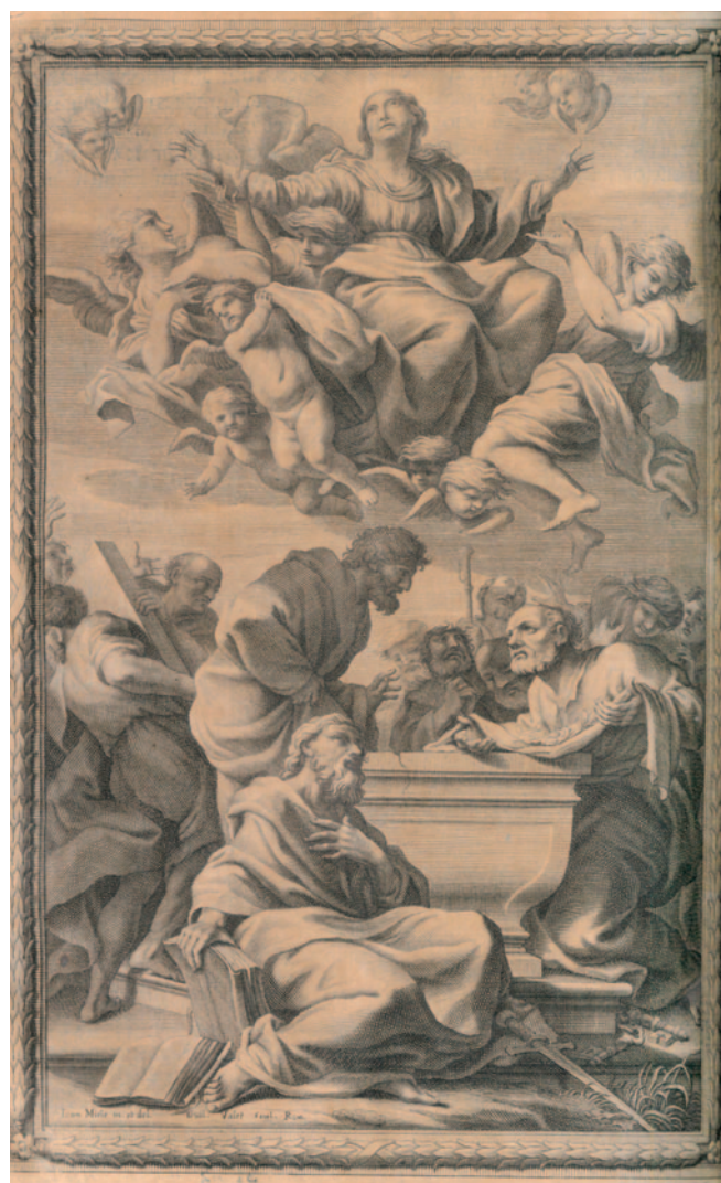
Fig. 20. Jan Miel (inv.), Assunzione della Vergine , Missale Romanum [Roma 1662], 339 x 225 mm (Archivio Storico Diocesano di Palermo).