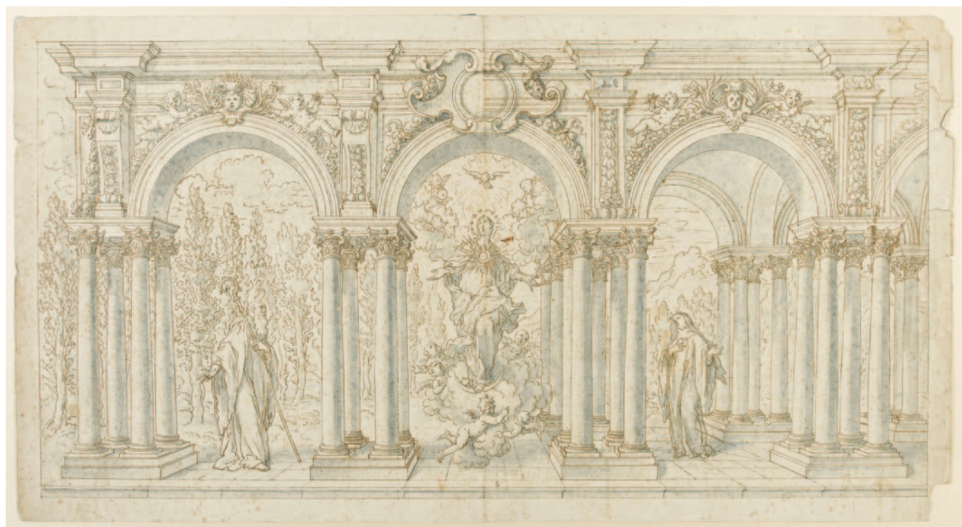
Fig. 6. Antonino Grano, progetto per paliotto mobile in argento con l'Immacolata Concezione tra San Benedetto e Santa Scolastica, penna a inchiostro bruno e acquerello grigio-blu, 407 x 757 mm (Paris, Musée du Louvre, Département des Arts graphiques, inv. 12606 recto, © GrandPalaisRmn (musée du Louvre) / Thierry Le Mage).

Nel documento di obbligazione del 1703, un'annotazione finale stabiliva, a tal proposito, che i pagamenti allo stuccatore sarebbero stati effettuati settimanalmente secondo quanto «arbitrato» da Amato e Grano, definiti entrambi «architetti di detta opera» 40 . Questo genere di clausole suggerisce, qui come in altri cantieri, un deciso controllo da parte dell'architetto nella fase esecutiva, in particolare nei confronti degli scultori. Nel 1708 lo stesso Procopio intraprese, infatti, insieme al padre Giacomo e allo zio Giuseppe (1653-1719), i lavori per la volta della chiesa della Pietà, altro cantiere diretto dall'architetto crocifero, che si riservava un'ancora più stringente valutazione dell'opera, anche in quel caso insieme a Grano, autore degli affreschi 41 . L'appellativo di «architetto» riservato anche a quest'ultimo nel contesto delle Vergini, in associazione ai ragionamenti presentati in merito alla sua collaborazione con Amato,