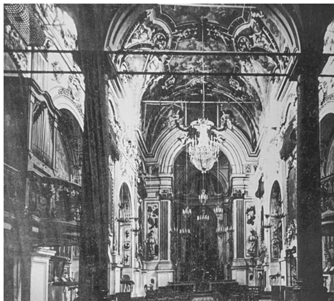
Fig. 13. Navata della chiesa delle Vergini (fotografia ante 1943 - Soprintendenza per i Beni Culturali e Ambientali di Palermo, Archivio Fotografico).

La collocazione delle tele mariane sulle porzioni di parete non occupate dalle cappelle laterali è apprezzabile in una fotografia dell'interno della navata [fig. 13]. Il supporto di ulteriore documentazione fotografica, oltre che di alcuni disegni inediti, ha permesso di risalire alla configurazione iconografica di almeno quattro dei sei dipinti del ciclo pittorico. Due immagini mostrano, innanzitutto, i dipinti raffiguranti rispettivamente l'Immacolata tra le braccia di Dio Padre [fig. 14], da ritenere verosimilmente eseguita da Bongiovanni, e la scena della Nascita della Vergine [fig. 15], quest'ultima invece riferibile a Grano 61 . Le opere presentavano il profilo superiore convesso, leggermente sporgente, mentre il bordo inferiore, al contrario, interessato da una concavità verso l'interno, utile ad accogliere gli elementi della decorazione in stucco. I quadri erano impreziositi, difatti, da cornici con motivi ornamentali, ed elegantemente incastonati entro paraste scanalate al di sotto delle gelosie. La foto del quadro della Nascita della Vergine , in particolare, si è rivelata uno strumento essenziale per stabilire un collegamento tra il cantiere benedettino e un disegno, inedito, conservato anch'esso presso il Museo del Louvre [fig. 16]. Il foglio, in passato assegnato a Francesco Trevisani e successivamente a Nicola Maria Rossi, è stato correttamente ricondotto alla mano di Grano da Catherine Monbeig Goguel 62 . Un