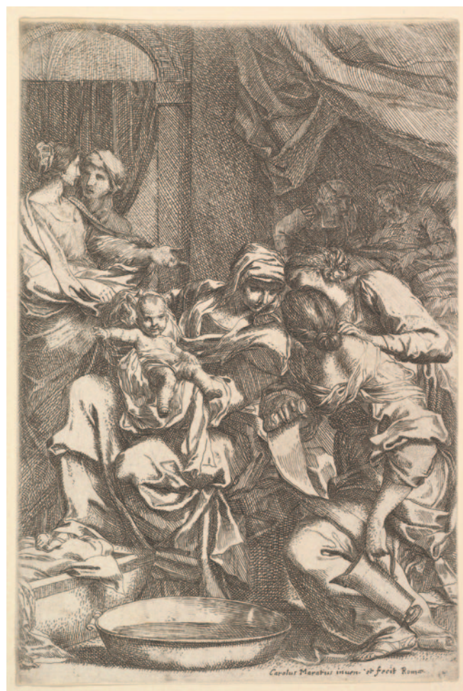
Fig. 18. Carlo Maratti (inv.), Nascita della Vergine , stampa, 215 x 145 mm (The Metropolitan Museum of Art - New York).