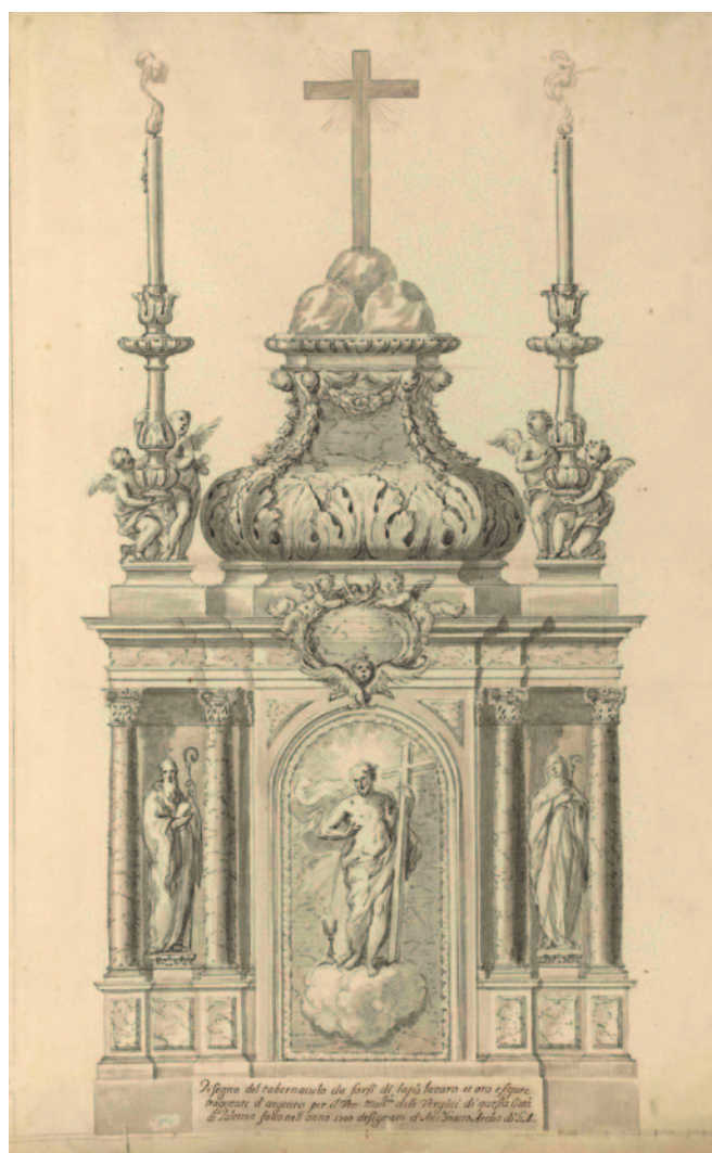
Fig. 5. Giacomo Amato e Antonio Grano, alzato per il tabernacolo in oro, argento e lapislazzuli per la chiesa delle Vergini, 1700, matita nera e acquerello in toni di grigio, 522 x 362 mm (Palermo, Galleria Regionale della Sicilia di Palazzo Abatellis, Gabinetto Disegni e Stampe, inv. 15758/dis.18).

zionali, ma è giunta inoltre alla conclusione dell'incompatibilità tra tali prove grafiche e l'opera di Rossi, suggerendo una necessaria riassegnazione a favore di Grano, dato il chiaro legame di alcuni di questi disegni con le realizzazioni dell'artista palermitano. Il suo contributo si configura pertanto come un punto di partenza imprescindibile per una qualsiasi ulteriore indagine sulla questione. Il disegno preso in esame, dunque, recentemente ripubblicato da Sabina de Cavi, «rappresenta il fronte architettonico di un loggiato ad arcate impostate su gruppi tetrastili [...] che aprono su uno sfondo di paesaggio» 26 . All'interno dell'arcata centrale si staglia la figura dell'Immacolata, in quelle laterali, secondo uno schema affine al tabernacolo appena menzionato, campeggiano le figure di Benedetto e Scolastica, chiaro indizio di come il foglio, da intendersi