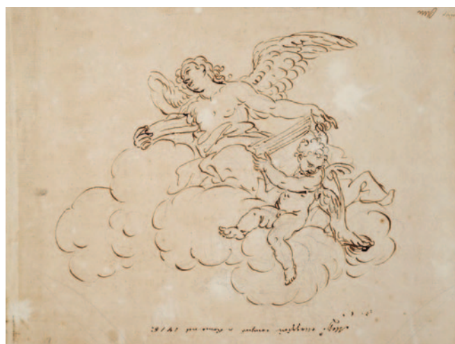
Fig. 10. Antonio Grano, studio di angelo , penna a inchiostro bruno, 246 x 297 mm, verso (Marty de Cambiaire Fine Arts).