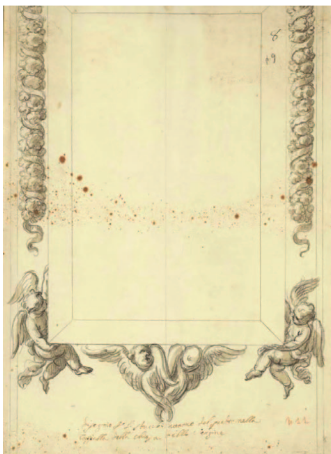
Fig. 2. Giacomo Amato e Antonio Grano, cornice in stucco per un quadro in una cappella della chiesa delle Vergini, 1700 ca., matita nera e acquerello in toni grigio-bruni, 337 x 246 mm (Palermo, Galleria Regionale della Sicilia di Palazzo Abatellis, Gabinetto Disegni e Stampe, inv. 15756/dis.7).

Sant'Andrea delle Vergini, nel quale le religiose iniziarono a celebrare ufficialmente a partire dal mese di luglio dello stesso anno 9 . Dal 1699, tanto il complesso monastico quanto la nuova chiesa furono oggetto di una serie di interventi eseguiti sotto la direzione dell'architetto Giacomo Amato (1643-1732) 10 , che videro significativamente coinvolto, su più fronti, anche il pittore Antonio Grano (1660-1718), tra i suoi più assidui e stretti collaboratori 11 .