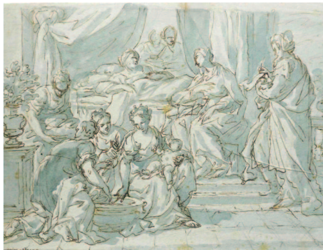
Fig. 17. Antonio Grano, Nascita del Battista , penna a inchiostro bruno e acquerello sui toni del blu, 192 x 260 mm, recto, collezione privata (da Monbeig Goguel, 2022, p. 152).