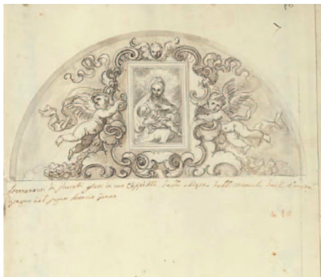
Fig. 1. Giacomo Amato e Antonio Grano, decorazioni in stucco per una cappella nella chiesa delle Vergini, 1700 ca., matita nera e acquerello in toni grigio-bruni, 344 x 500 mm (Palermo, Galleria Regionale della Sicilia di Palazzo Abatellis, Gabinetto Disegni e Stampe, inv. 15756/dis.6).