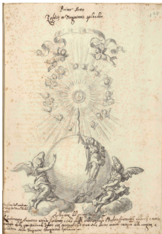
Fig. 4. Giacomo Amato e Antonio Grano, apparato per la festa delle Quarantore nella chiesa delle Vergini, 1699, matita nera e acquerello in toni di grigio, 433 x 313 mm (Palermo, Galleria Regionale della Sicilia di Palazzo Abatellis, Gabinetto Disegni e Stampe, inv. 15757/dis.33).