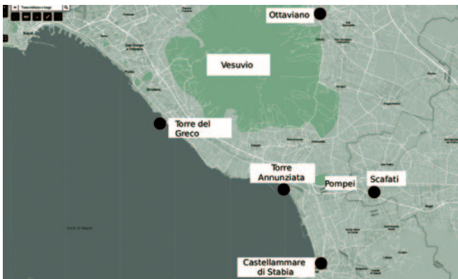
Fig. 2. Ricostruzione della collocazione di Pompei secondo le fonti. Esatta collocazione di Pompei in corrispondenza di Civita: Lettieri (1560); Olstenio (1666); Macrino (1693); Parrino (1700); Paragallo (1705). Pompei come Torre dell'Annunziata: Biondo (1446); Di Falco (1548); Leandro Alberti (1550); Nigro (1557); Sanfelice (1562); Colo Anello Pacca (ante 1570); Giuliani 1632; Capaccio (1634); Mormile (1670). Pompei come Castellammare di Stabia: Collenuccio (ante 1504). Pompei come Torre del Greco: Collenuccio (ante 1504); Maffei Volterrano (1544). Pompei vicino a Ottaiano (Ottaviano): Ligorio (1558). Pompei come San Pietro a Scafati: Sannazaro (1504); Leone (1514); Cluverio 1624 (elaborazione dell'autrice).

I nuovi ritrovamenti, però, non scalfiscono le vecchie opinioni. La proposta di Sanfelice, relativa all'identificazione di Ercolano e Pompei con Torre del Greco e Torre Annunziata, è ripresa nel Forastiero (1634) di Giulio Cesare Capaccio, una guida del territorio campano costruita come un dialogo 21 . Giuseppe Mormile, redigendo una descrizione della città di Napoli (1670), accoglie la corrispondenza tra Pompei e Torre Annunziata, mentre sposta Ercolano verso villa di Serina (sic.), toponimo per il quale non mi è stato possibile identificare una corrispondenza contemporanea 22 . È opportuno sottolineare che il dedicatario dell'opera era l'architetto Francesco Antonio Picchiatti, noto per il suo 'museo' di naturalia e artificialia in cui erano convogliati numerosi pezzi antichi rinvenuti durante varie campagne di scavo, secondo alcuni provenienti proprio da Pompei - ma l'ipotesi, ad oggi, è impossibile da dimostrare 23 . Nel 1700, a pochi decenni dall'avvio degli scavi che avrebbero risolto definitivamente la questione, Domenico Antonio Parrino dà alle stampe Napoli città nobilissima, antica, e fedelissima , che include un aggiornamento critico degli studi topografici su Pompei, dalle fonti antiche - Velleio, Plinio Secondo, Pomponio Mela, Seneca, Tacito - fino agli autori a lui più vicini, come il geografo Cluverio, di cui