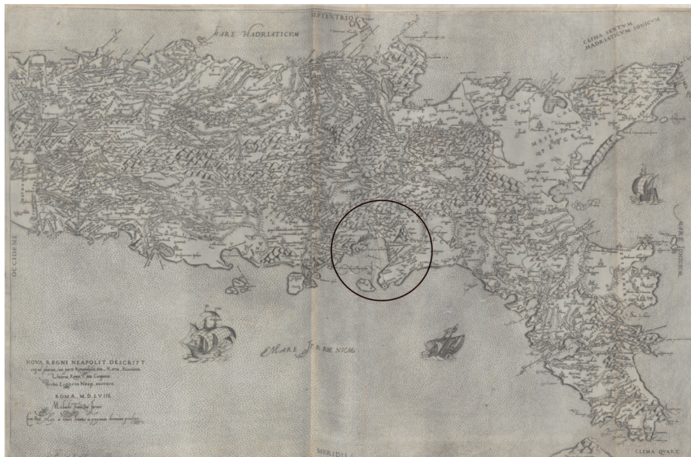
Fig. 4. Pirro Ligorio & Michele Tramezzino, Regno di Napoli , Roma 1558. Primo stato ( https://www.bavarikon.de/object/bav:SBD-HSS-00000BSB00107350?p=1&lang=en ).

Un contributo importante nel dibattito sulla topografia delle città vesuviane proviene da Pirro Ligorio, che pone in dialogo lo studio antiquario con l'osservazione dei fenomeni sismici, mescolando, com'è tipico del suo metodo, l'analisi dei resti materiali con l'invenzione creativa, considerata talvolta una vera falsificazione 29 . L'antiquario si occupa della Campania Felix in tre opere scritte e in una rappresentazione cartografica. Nella cosiddetta Enciclopedia delle Antichità , Ligorio inserisce una voce su «Resina», senza esplicitare un collegamento con il toponimo antico 30 . Che Ligorio non fosse a conoscenza della relazione topografica tra i due centri è confermato dalla voce HERCULANIO, in cui la città antica è collocata in corrispondenza di Torre del Greco o di Torre dell'Annunziata 31 .