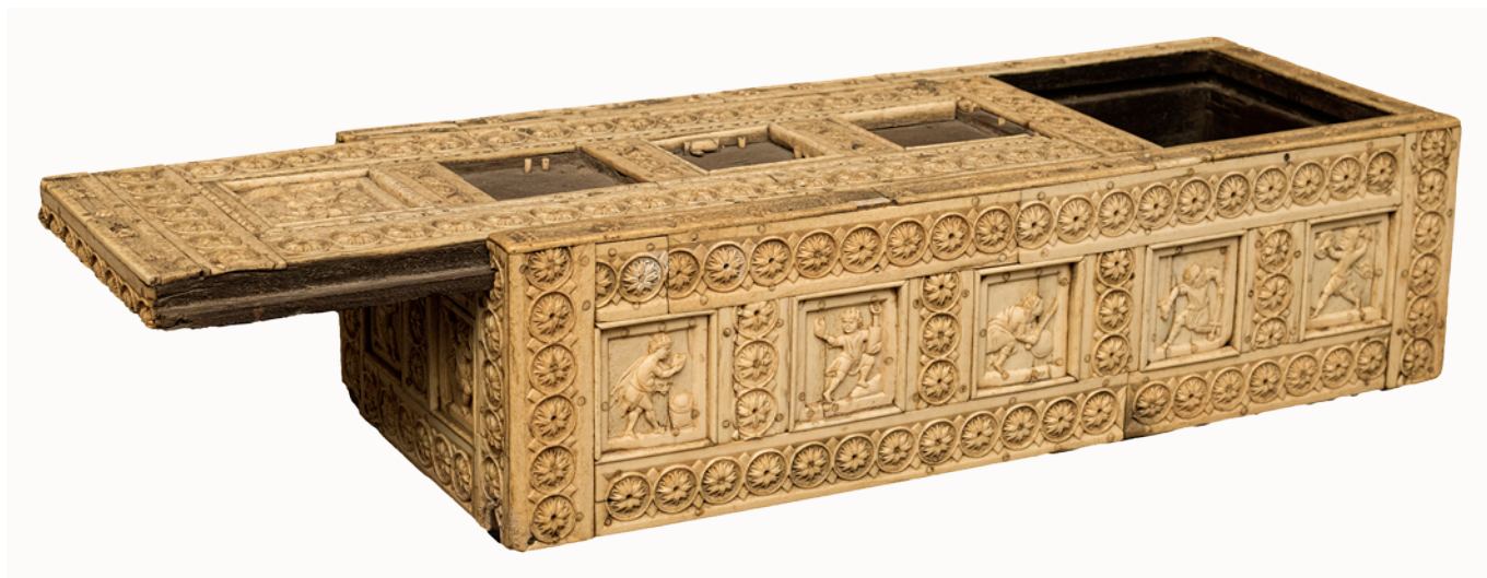
Fig. 1. Bottega costantinopolitana, Rosette casket, avorio intagliato, legno, ante 1109 (Palermo, Tesoro Cappella Palatina, Chiesa di Santa Maria delle Grazie, inv. n. 125, Ministero dell'Interno - F.E.C., da G. Travagliato, Eburnea dona... , cit.).

Sulle circostanze che determinarono il trasferimento del documento - entro il suo ipotetico raffinato contenitore eburneo - nel Palazzo Reale di Palermo dalla casa di Cristodulo, cristiano greco benefattore del monastero di Santa Maria del Pàtire e fondatore del monastero di San Sebastiano presso Castel San Mauro, entrambi nel territorio di Corigliano-Rossano in Calabria, nonché di Santa Maria della Grotta a Marsala (1107-1108) 10 e, tradizionalmente, di una o più chiese (1113) dedicata/e alla Madonna, a San Matteo, ai SS. Senatore, Viatore e Cassiodoro 11 (che dovette dotare delle rispettive reliquie, passate anch'esse nel patrimonio della Cappella Palatina) ubicata/e nei pressi del Sacrum Regium Palatium , una di queste talora identificata con la stessa chiesa inferiore 12 , non si ha alcuna certezza: potrebbe essere avvenuto alla fine della carriera del personaggio, quando, calunniato da Giorgio d'Antiochia e condannato alla pena capitale, gli sarebbero stati confiscati i beni o, più probabilmente, perdonato dal sovrano, dopo la sua morte per cause naturali (†1130 ca.), in virtù di legato testamentario in favore della detta chiesa o del clero palatino 13 .