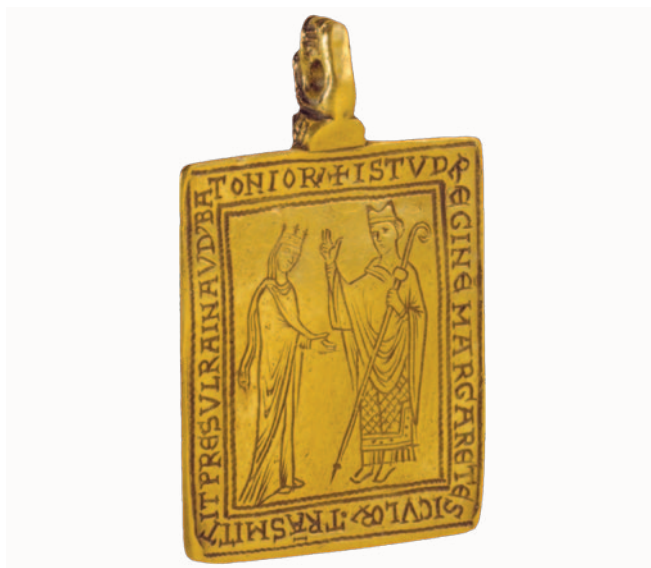
Fig. 11. Bottega inglese (Canterbury?), pendente reliquiario di San Thomas Becket, oro sbalzato, cesellato, inciso con parti fuse, post 1174/1177 ca. (New York, Metropolitan Museum of Art, The Cloisters, inv. n. 63.160).