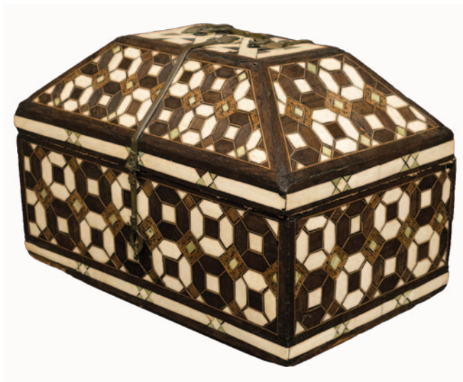
Fig. 7. Bottega dell'Egitto fatimide (Il Cairo?), cassetta parallelepipedica con coperchio tronco-piramidale, incrostazione in avorio e mastice policromo su struttura lignea, secondo-terzo quarto del XII sec. (Palermo, Tesoro Cappella Palatina, Chiesa di Santa Maria delle Grazie, inv. n. 130, Ministero dell'Interno - F.E.C., da G. Travagliato, Eburnea dona... , cit.).