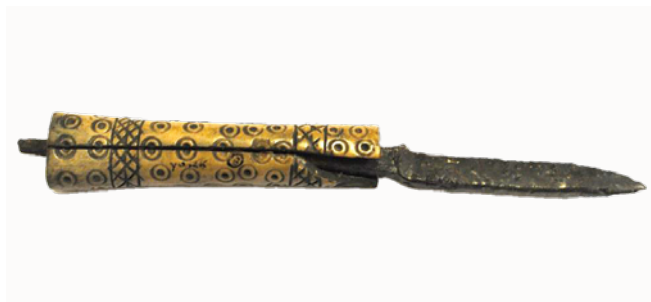
Fig. 10. Bottega anglo-scandinava, coltello, ferro battuto, osso inciso e brunito, fine IX/XII sec. (York Museums Trust, inv. YORUM 1948.620).