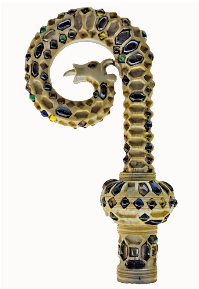
Fig. 8. Bottega arabo-sicula (?), riccio di baculo pastorale detto "di San Cataldo", avorio intagliato, tornito e inciso, paste vitree policrome, post 1151, fine XII/inizi XIII sec. (Palermo, Tesoro Cappella Palatina, Chiesa di Santa Maria delle Grazie, Ministero dell'Interno - F.E.C., da G. Travagliato, Eburnea dona... , cit.).

tabilmente per il materiale considerato di minor pregio (osso piuttosto che avorio) e la fattura piuttosto grossolana in confronto agli altri pezzi della collezione palatina, oltre che per la mancanza di raffronti efficaci che potessero contribuire all'individuazione di datazione e luogo di produzione.