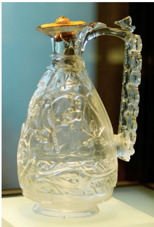
Fig. 5. Bottega dell'Egitto fatimide (Il Cairo?), brocca dal tesoro di Saint-Denis, cristallo di rocca inciso, filigrana d'oro, fine X sec., prima metà XII sec. (Parigi, Louvre, Département des Objets d'art du Moyen Age, de la Renaissance et des temps modernes, inv. MR333).