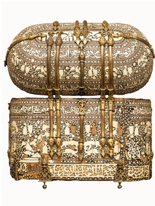
Fig. 6. Bottega dell'Egitto fatimide (Il Cairo?), bauletto oblungo con bordi arrotondati e coperchio bombato, incrostazione in avorio e mastice policromo su struttura lignea, secondo-terzo quarto del XII sec. (Palermo, Tesoro Cappella Palatina, Chiesa di Santa Maria delle Grazie, inv. n. 130, Ministero dell'Interno - F.E.C., da G. Travagliato, Eburnea dona..., cit.).