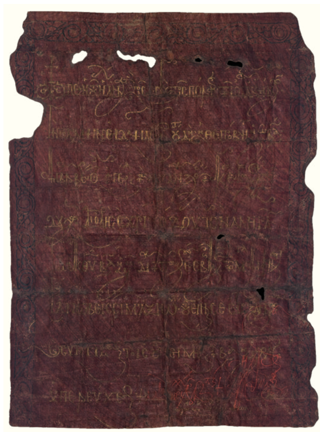
Fig. 3. Cancelleria imperiale di Costantinopoli, Kodikellos dell'imperatore Alessio I per l'amerās Cristodulo, pergamena purpurea vergata in oro e argento, aprile 1109 (Palermo, Tabulario Cappella Palatina, n. 2, Ministero dell'Interno - F.E.C., da V. von Falkenhausen, Il kodikellos... , cit.).