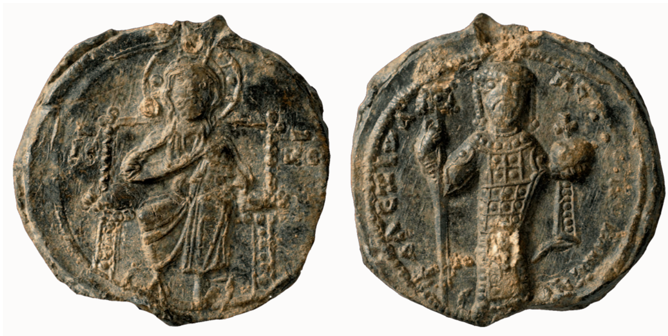
Fig. 4. Cancelleria imperiale di Costantinopoli, Κροσόβουλλος dell'imperatore Alessio I, impressione metallica, 1081-1118 (Washington DC, Dumbarton Oaks Museum, Byzantine Collection, DO Seals 6).