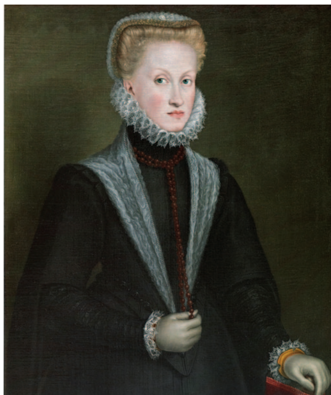
Fig. 6. Sofonisba Anguissola, Ritratto della regina Anna d'Austria, 1573 ca. (Madrid, Museo del Prado, inventory number P001284).