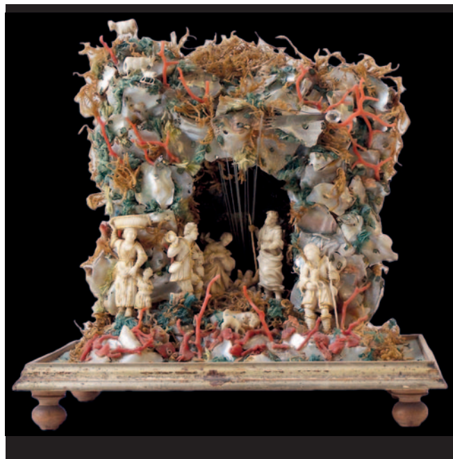
Fig. 14. Maestranze trapanesi (Andrea Tipa e aiuti, attr.), presepe, metà del XVIII secolo (Trapani, Museo regionale "Agostino Pepoli", inv. 4372).