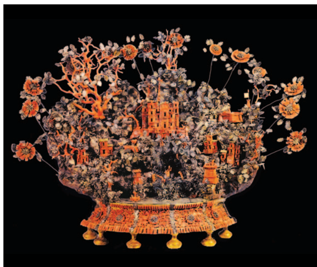
Fig. 9. Maestranze trapanesi, scena marina, fine del XVII secolo (Piazza Armerina, Museo Diocesano).

Ritornando alla "montagna di corallo" fortunatamente resta una accurata descrizione datata 9 febbraio 1571 che, pur nella sua assenza fisica, ha contribuito a mantenere vivo nei secoli il fuoco del suo agognato ritrovamento. Fu redatta, come parte integrante della registrazione del suo pagamento, da don Pietro Giovanni De Gregorio, tesoriere generale del regno di Sicilia dal 1566 42 . Era composta da moltissime figure sacre in corallo scolpito, da rami di corallo e da circa 25 fontane verosimilmente anch'esse in corallo, che insieme alla sua forma ascendente complessiva dovettero dare luogo alla denominazione con cui è ancora oggi nota. Le sculture erano parte di diversi gruppi: un'Annunciazione con Dio Padre; un'Adorazione dei Pastori; un Annuncio ai Pastori; una Natività; la Fuga in Egitto, scene della Passione (l'orazione nell'orto degli ulivi, la flagellazione di Cristo che includeva a sua volta otto misteri con circa sessanta personaggi a rilievo), e ancora raffigurazioni di santi molto popolari all'epoca in Sicilia e a Trapani [fig. 10] e tipiche della produzione dei maestri corallai 43 (san Francesco nella grotta; un crocifisso, un compagno di san Francesco; san Girolamo nella grotta; un altare e un fonte battesimale; edicola con san Giacomo; edicola con santa Caterina; edicola