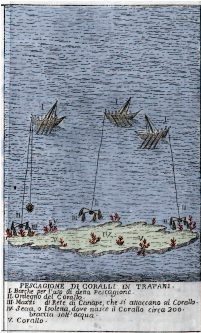
Fig. 7. Pescazione di coralli in Trapani (da Arcangelo Leanti, Lo stato presente della Sicilia, o sia breve, e distinta descrizione di essa, Palermo, Per Francesco Valenza, 1761, collezione privata).