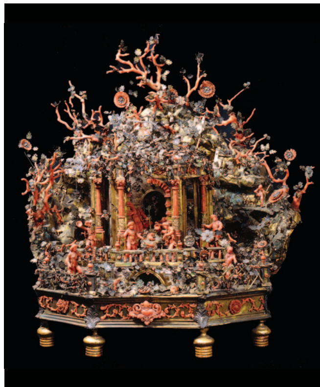
Fig. 12. Maestranze trapanesi, presepe , fine del XVII secolo (collezione privata).

Il Mediterraneo come terra di confine, per citare Linda T. Darling 47 , permette, dunque, di inquadrare e comprendere più a fondo anche fenomeni storico-artistici legati alla circolazione di opere d'arte e alla produzione culturale che hanno generato. La "montagna di corallo", in tal senso, diviene alla fine del XVI secolo un esempio paradigmatico, indissolubilmente legato alla figura di don Francesco Ferdinando d'Avalos d'Aquino d'Aragona e alle guerre corsare nel Mediterraneo, entrambi a loro volta strettamente correlati.