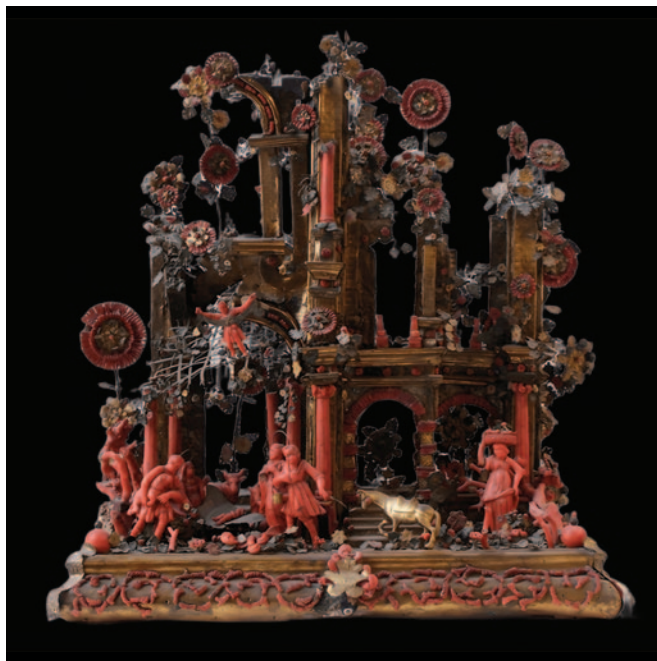
Fig. 13. Maestranze trapanesi, presepe con struttura architettonica, inizio del XVIII secolo (Trapani, Museo regionale "Agostino Pepoli", inv. 4359, © Archivio fotografico Museo Regionale di Trapani "Agostino Pepoli").