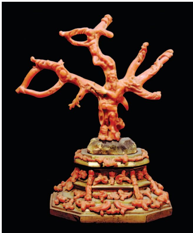
Fig. 11. Maestranze trapanesi, ramo con san Girolamo , seconda metà del XVII secolo (collezione privata).

con san Vito; edicola con san Giovanni Battista; edicola con la Madonna di Trapani; san Sebastiano flagellato nel bosco). I connotati religiosi e devozionali dell'intera composizione, legati a episodi neotestamentari della nascita e della passione di Cristo e alla sua discendenza, ben esemplificano l'incertezza storica dei tempi (tra ondate di peste, carestie, incursioni barbaresche, etc.) e sarebbero divenuti sempre più tipici delle opere dei maestri trapanesi nel corso del XVII secolo [fig. 11] 44 . Il peso dell'opera nei secoli è stato notevole prima come fonte di ispirazione per gli artisti siciliani [fig. 12] e poi come punto di riferimento per gli studi sulla storia delle arti decorative siciliane in termini sia stilistici che cronologici 45 . Viene, inoltre, ormai considerata il modello per la rinomata tradizione presepiale polimaterica (corallo, madreperla, avorio, alabastro, etc.) trapanese del XVII e del XVIII secolo che fu apprezzata presso i più importanti collezionisti in virtù dei preziosi materiali legati al territorio siciliano ma anche per le ridotte dimensioni dei manufatti che permettevano di trasportarli con facilità entro scarabattoli [figg. 13-14] 46 .