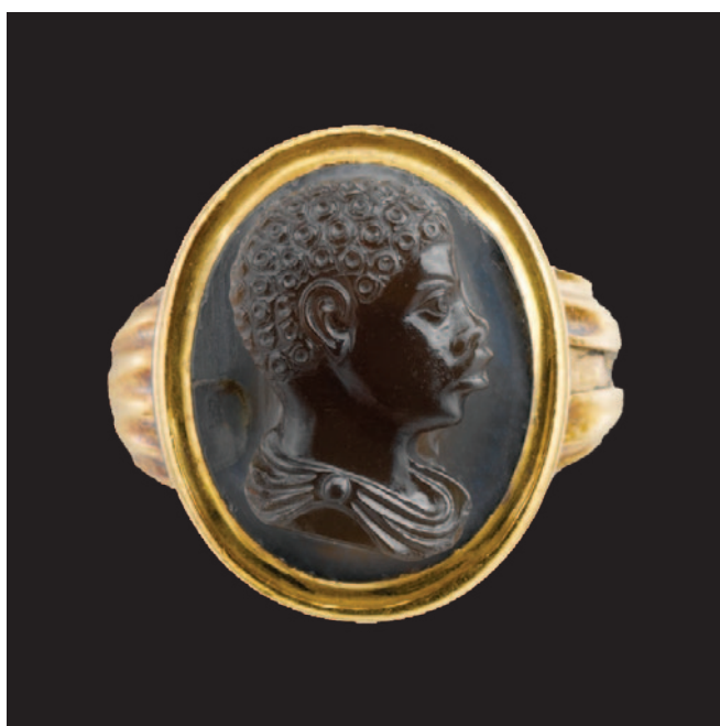
Fig. 3. Anello con busto di ragazzo africano, fine del XVI secolo, provenienza Italia, probabilmente Venezia (New York, The Met, accession number 38.150.27).