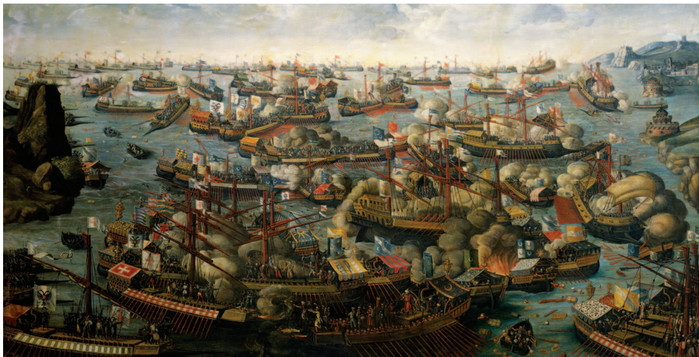
Fig. 2. La battaglia di Lepanto, fine del XVI secolo (© National Maritime Museum, Greenwich, London, id. BHC0261).

tettivi e scaramantici, ma con alle spalle ugualmente secoli di oreficeria romana e ellenistica. La domestichezza con la guerra di corsa, la pirateria, il mercato degli schiavi e il loro riscatto appaiono evidenti nella società del tempo, soprattutto se si pensa che a partire dalla fine del secolo tale gioiello ebbe grande fortuna a Venezia [fig. 3], dominatrice sulle rotte mediterranee e negli scambi con l'Oriente, dove in un secondo momento si sarebbe evoluto nel cosiddetto "moretto veneziano" 10 .