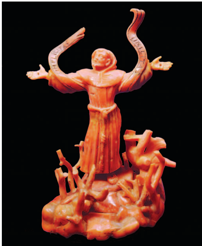
Fig. 10. Francesco De Alferi (Alferi), San Francesco riceve le stimmate , seconda metà del XVI secolo (collezione privata).