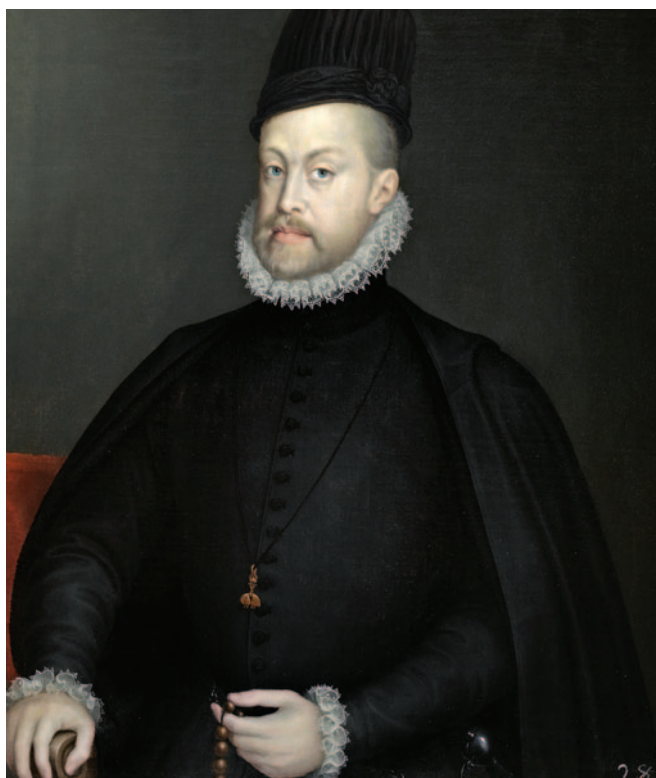
Fig. 5. Sofonisba Anguissola, Filippo II, 1573 (Madrid, Museo del Prado, inventory number P001036).