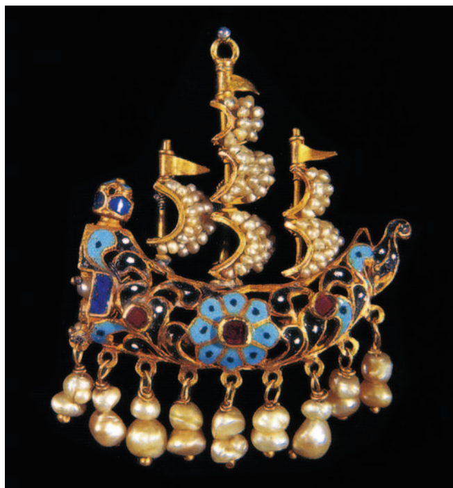
Fig. 1. Orofio siciliano, pendente a veliero, fine del XVII secolo (collezione privata, ph. © Enzo Brai).

Ángela de la Cerda y Manuel, figlia del viceré Juan de la Cerda y de Silva duca di Medinaceli, adusi a corseggiare se si pensa che «la duchessa di Bivona nel 1570 chiedeva e otteneva di poter armare una galeotta per ‘mandarla in corso’, mentre fervevano i preparativi di Lepanto» [fig. 2] 8 . Fenomeno, quello del gioiello riprodotto velieri, aggiornato alle dinamiche stori-