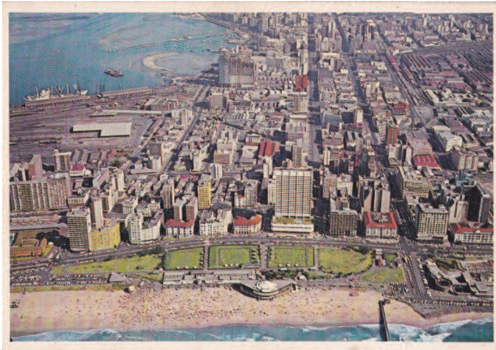
6_Cartolina dell'area centrale del lungomare di Durban con il Mermaid Lido, anni '70.