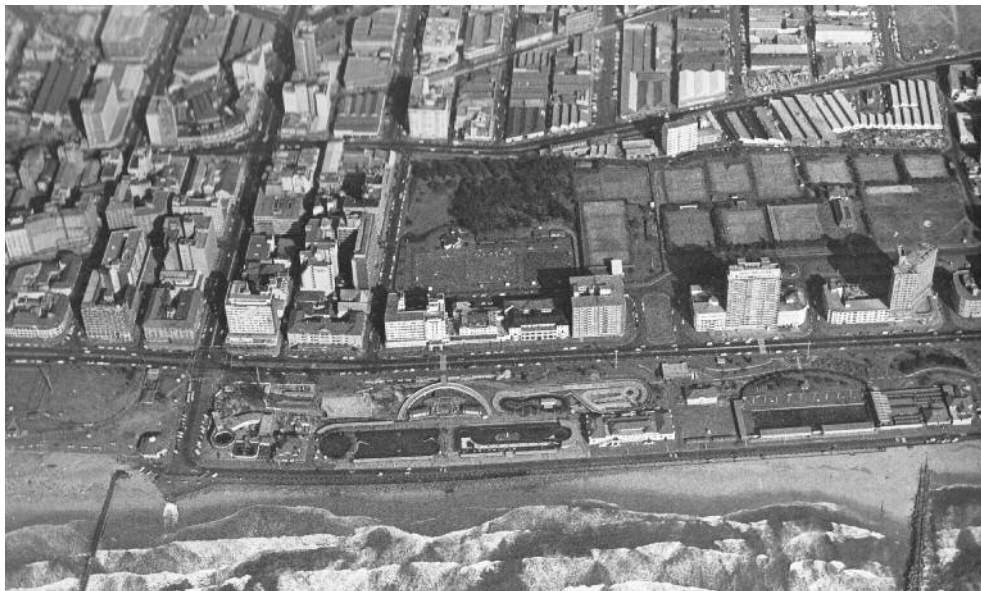
3_Vista aerea dell'area centrale del lungomare di Durban, fine anni '60 (Central Durban Planning Project, Town Planning Branch of the City Engineer's Department, Durban Municipality, ora eThekweni Metropolitan Municipality).